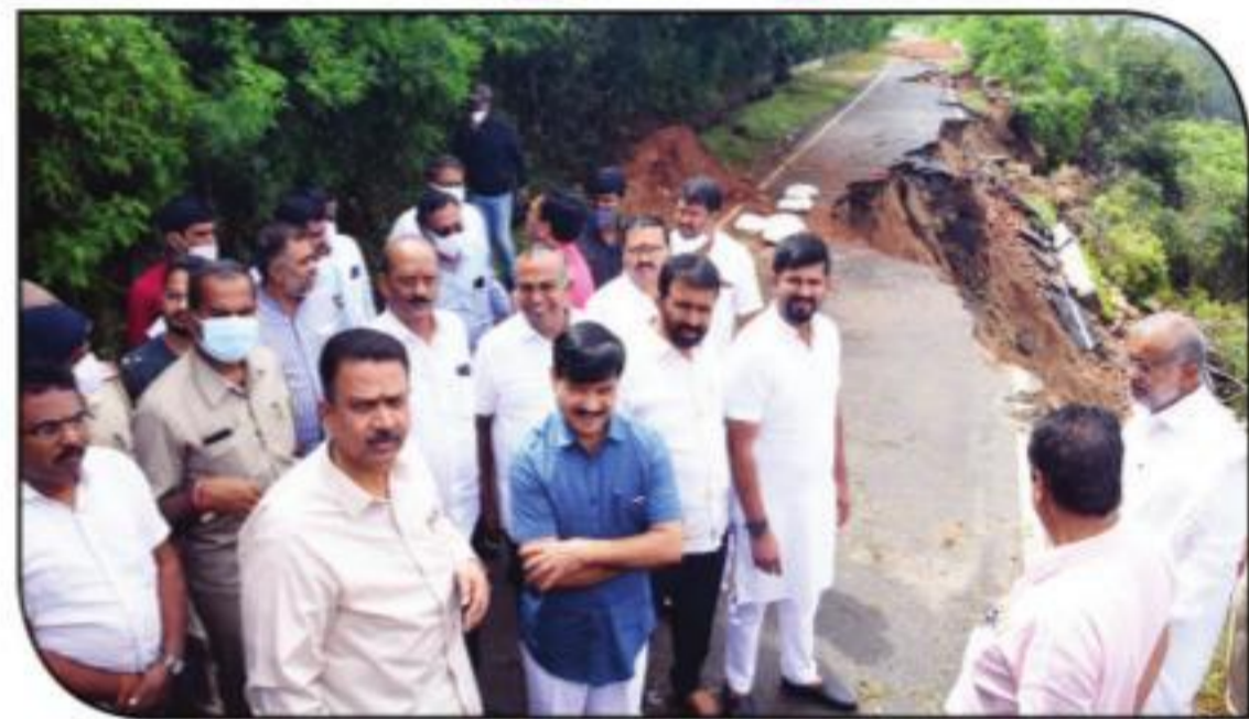
2021 ನವೆಂಬರ್‌ನಲ್ಲಿ ಭಾರೀ ಮಳೆಯಿಂದಾಗಿ ನಂದಿ ಬೆಟ್ಟ ಮತ್ತು ಚಾಮುಂಡಿ ಬೆಟ್ಟ ರಸ್ತೆಗಳು ಭಾಗಶಃ ಹಾನಿಗೀಡಾಗಿದ್ದು, ಇವುಗಳ ದುರಸ್ತಿ ಕಾಮಗಾರಿಗಳನ್ನು ನಡೆಸಲಾಗುತ್ತಿದೆ. ನಂದಿ ಬೆಟ್ಟ ರಸ್ತೆಯ ದುರಸ್ತಿ ಕಾಮಗಾರಿ ಈಗಾಗಲೇ ಪೂರ್ಣಗೊಂಡಿದ್ದು, ರಸ್ತೆಯನ್ನು ವಾಹನ ಸಂಚಾರಕ್ಕೆ ಮುಕ್ತಗೊಳಿಸಲಾಗಿದೆ.