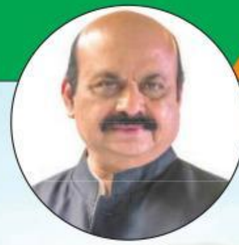
ಶ್ರೀ ಬಸವರಾಜ ಬೊಮ್ಮಾಯಿ ಸನ್ಮಾನ್ಯ ಮುಖ್ಯ ಮಂತ್ರಿಗಳು