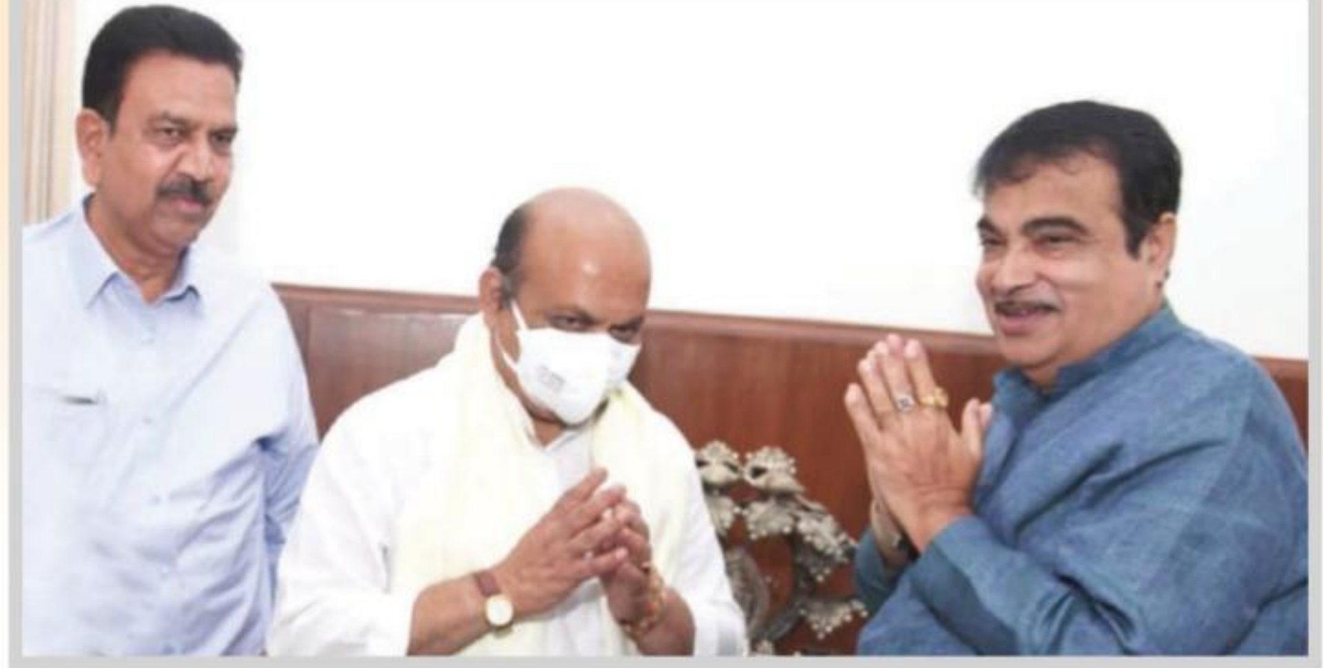
ಕೇಂದ್ರ ಭೂ ಸಾರಿಗೆ ಮತ್ತು ಹೆದ್ದಾರಿ ಸಚಿವರಾದ ಶ್ರೀ ನಿತೀನ್ ಗಡ್ಡರಿ ಅವರಲ್ಲಿ ಸನ್ಮಾನ್ಯ ಶ್ರೀ ಬಸವರಾಜ ಬೊಮ್ಮಾಯಿ ಹಾಗೂ ಸಚಿವರಾದ ಶ್ರೀ ಸಿ.ಸಿ.ಪಾಟೀಲ ಅವರು ಕರ್ನಾಟಕ ಹೆದ್ದಾರಿ ಅಭಿವೃದ್ಧಿಗೆ ಹೆಚ್ಚಿನ ಅನುದಾನ ನೀಡುವಂತೆ ಮಾಡಲಾದ ಮನವಿಗೆ ಸಕಾರಾತ್ಮಕ ಸ್ಪಂದನ.

ರಸ್ತೆಗಳ ಉನ್ನತೀಕರಣ, ಬೃಹತ್-ಮಧ್ಯಮ ಸೇತುವೆಗಳು, ರಾಜ್ಯ-ರಾಜ್ಯ ಹೆದ್ದಾರಿ ರಸ್ತೆಗಳ ದುರಸ್ತಿಗೆ ಹೆಚ್ಚು ಒತ್ತು ಕೊಟ್ಟು ಶ್ರೀಮಾನ್ಯರ ಸಂಚಾರಕ್ಕೆ ಸಂಚಾರ ಬರದಂತೆ ಜಾಗೃತಿ ವಹಿಸುತ್ತಿರುವ ಲೋಕೋಪಯೋಗಿ ಇಲಾಖೆಯು ಇಡೀ ರಾಜ್ಯದಲ್ಲಿ ಸಂಪರ್ಕ ಕ್ರಾಂತಿ ಸೃಷ್ಟಿಸುವಂತೆ ಹೆಚ್ಚಿನ ಯೋಜನೆಗಳನ್ನು ಕೈಗೊಂಡು, ವ್ಯಾಪಾರ, ಕೃಷಿ ಚಟುವಟಿಕೆ ಸರಾಗವಾಗಿ ನಡೆಯಬೇಕು ಎಂದರೆ ಉತ್ತಮ ಗುಣಮಟ್ಟದ ರಸ್ತೆಗಳು ಅತ್ಯಗತ್ಯ. ಇದನ್ನು ಗಮನಿಸಿ ಲೋಕೋಪಯೋಗಿ ಇಲಾಖೆ ರಾಜ್ಯದ ಪ್ರತಿ ರಸ್ತೆಯನ್ನು ಉತ್ತಮ ರೀತಿಯಲ್ಲಿ ನಿರ್ಮಾಣ ಮಾಡುವ ಹಾಗೂ ನಿರ್ಮಿಸುವ ಅವಿರತ ಹೋರಾಟ ನಡೆಸಿದ್ದು, ಮಾನ್ಯ ಮುಖ್ಯಮಂತ್ರಿ ಬಸವರಾಜ್ ಬೊಮ್ಮಾಯಿ ಅವರು ಅಧಿಕಾರ ಸ್ವೀಕರಿಸಿದ ನಂತರ ಸಿ.ಸಿ.ಪಾಟೀಲರಿಗೆ ಲೋಕೋಪಯೋಗಿ ಇಲಾಖೆಯ ಸಚಿವರಾಗಿ ಅಧಿಕಾರ ನೀಡಲಾಗಿತ್ತು. ಈಗ ಕರ್ನಾಟಕದ ರಸ್ತೆಗಳು ಅಭಿವೃದ್ಧಿ ಪಥದತ್ತ ಸಾಗಿದೆ.