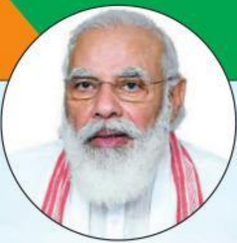
ಶ್ರೀ ನರೇಂದ್ರ ಮೋದಿ ಸನ್ಮಾನ್ಯ ಪ್ರಧಾನ ಮಂತ್ರಿಗಳು